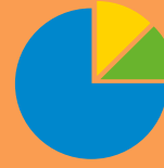
chart = graphic grafik, çizelge